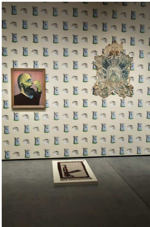
Gauche: Sidney Nolan, Colonial Head—Kelly Gang , 1943–46, sol: tapis de guerre afghan, droite: Wim Delvoye, Untitled (Osama), 2002–3, papier peint : Robert Gober, Hanging Man/Sleeping Man , 1989