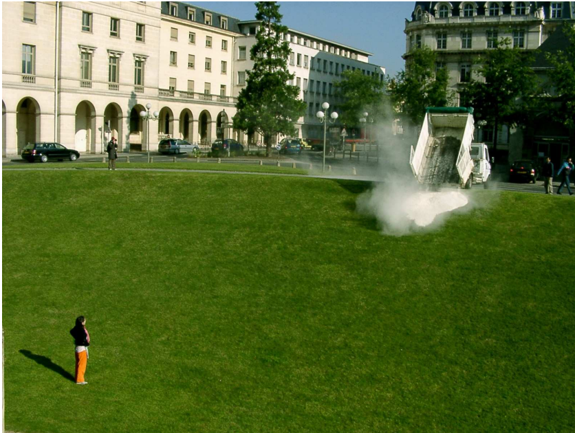
Coulée de Farine, mai 2005 © Marie Denis

information et réservation : info@lamaisonrouge.org