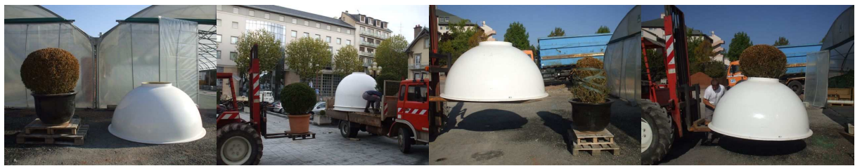
« Laboratoire du projet », en situation au Musée Denys-Puech, Rodez 2008

Une installation produite par les amis de la maison rouge pour le patio.