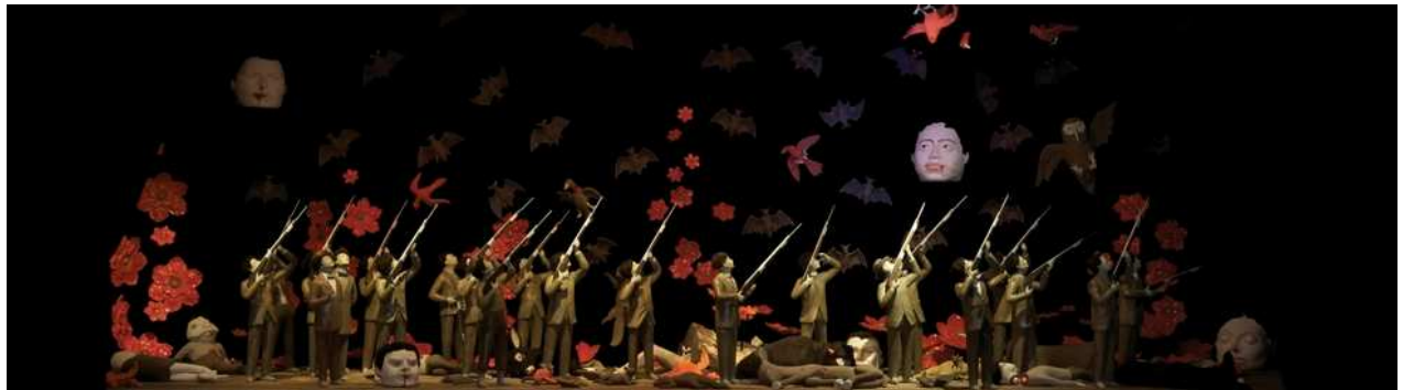
Marcel Dzama, Banks of the Red River , 2008

Leurs œuvres sont habitées de personnages hybrides, inspirés par la bande dessinée, la science fiction, le cinéma noir ou d'horreur, et l'univers télévisuel (comme « The Muppet Show ») dans lequel ont baigné les artistes pendant leur enfance.