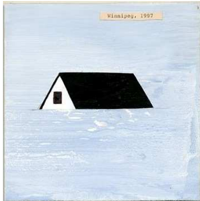
Royal Art Lodge, The Red River , 1997