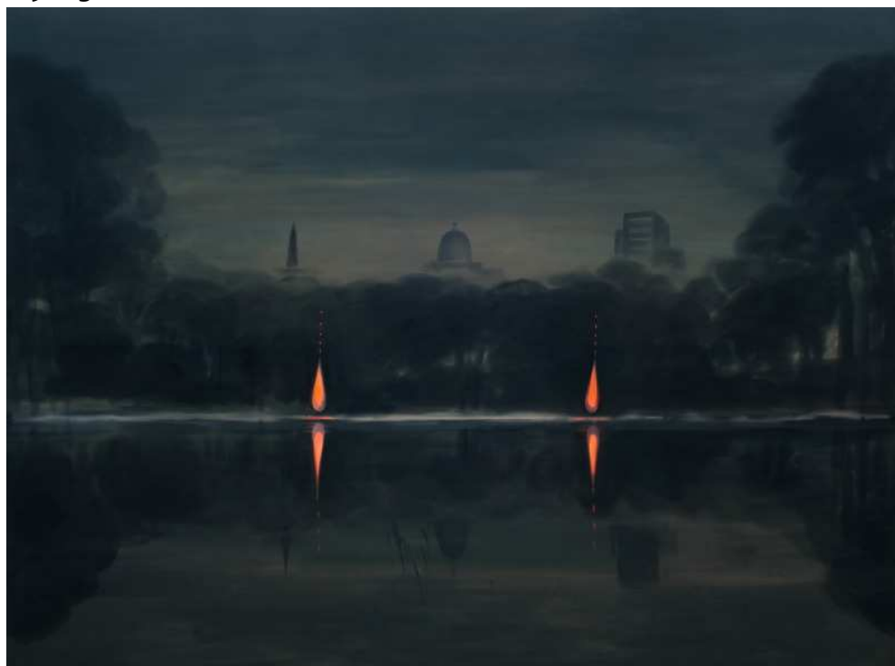
Wanda Koop, Native Fires' (from the See Everything / See Nothing series), 1996

Le paysage est l'une des grandes thématiques qui traversent l'exposition.