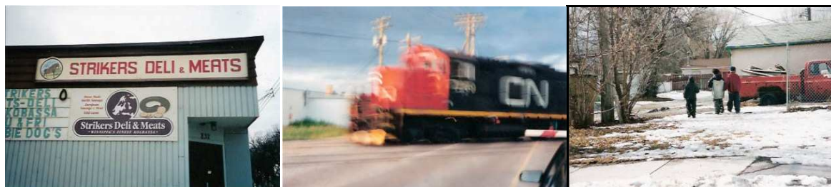
Noam Gonick, Strycker , 2007

Photographies de repérage du film de Noam Gonick, Strycker (2007)