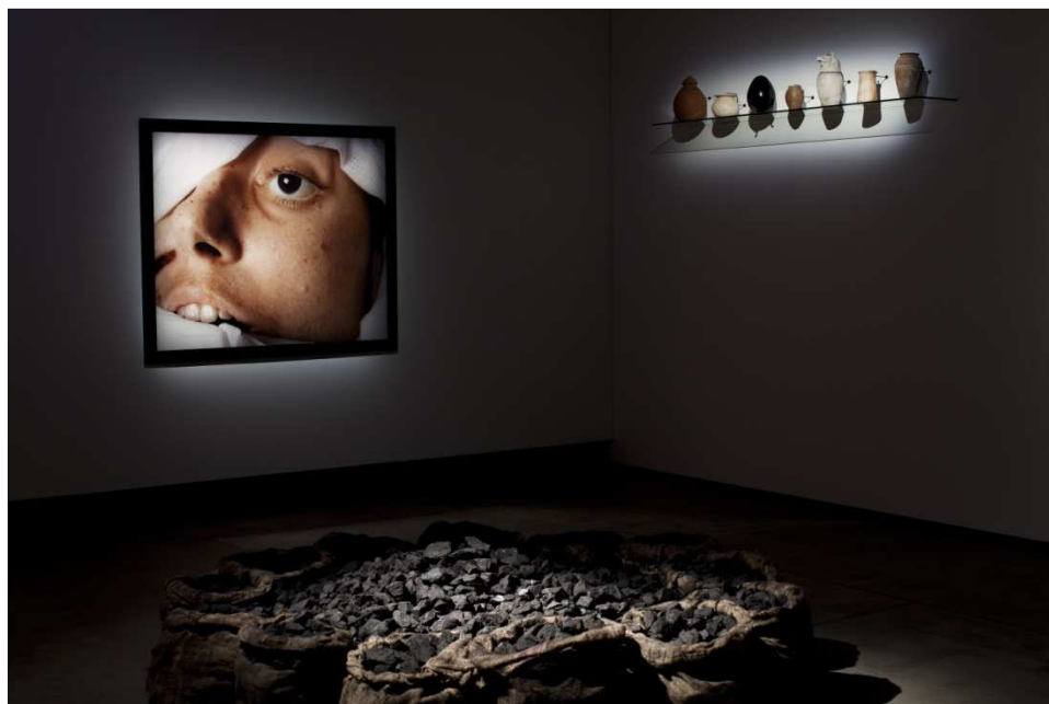
Gauche : Andres Serrano, The Morgue (Blood Transfusion Resulting In AIDS) , 1992, en haut à droite : divers objets et œuvres des collections du MONA et du TMAG, premier plan : Jannis Kounellis, 'Untitled' , 2012 © MONA/Rémi Chauvin Image Courtesy MONA Museum of Old and New Art, Hobart, Tasmania, Australia © TMAG