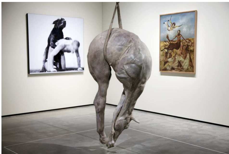
Gauche: Oleg Kulik, Family of the Future , 9, 1997, centre: Berlinde De Bruyckere, P.XIII , 2008, droite: Sidney Nolan, Centaur and Angel , 1952