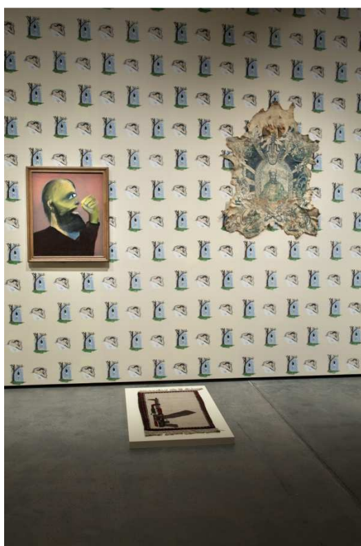
Gauche: Sidney Nolan, Colonial Head—Kelly Gang , 1943–46, sol: tapis de guerre afghan, droite: Wim Delvoye, Untitled (Osama), 2002–3, papier peint : Robert Gober, Hanging Man/Sleeping Man , 1989